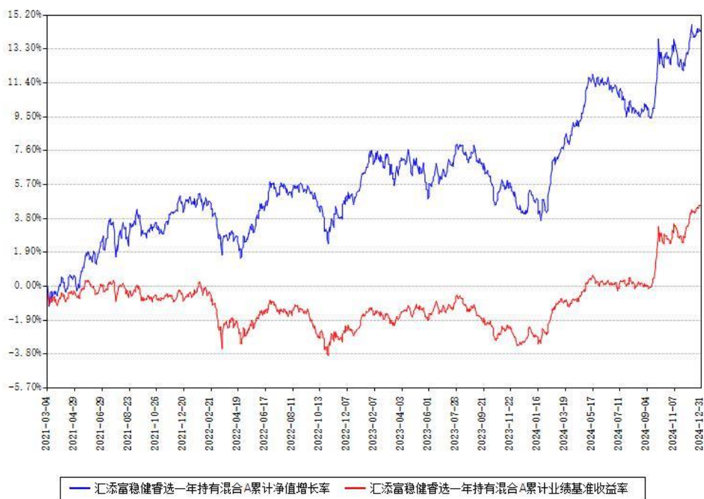
汇添富稳健睿选一年持有混合 A 累计净值增长率与同期业绩基准收益率对比图